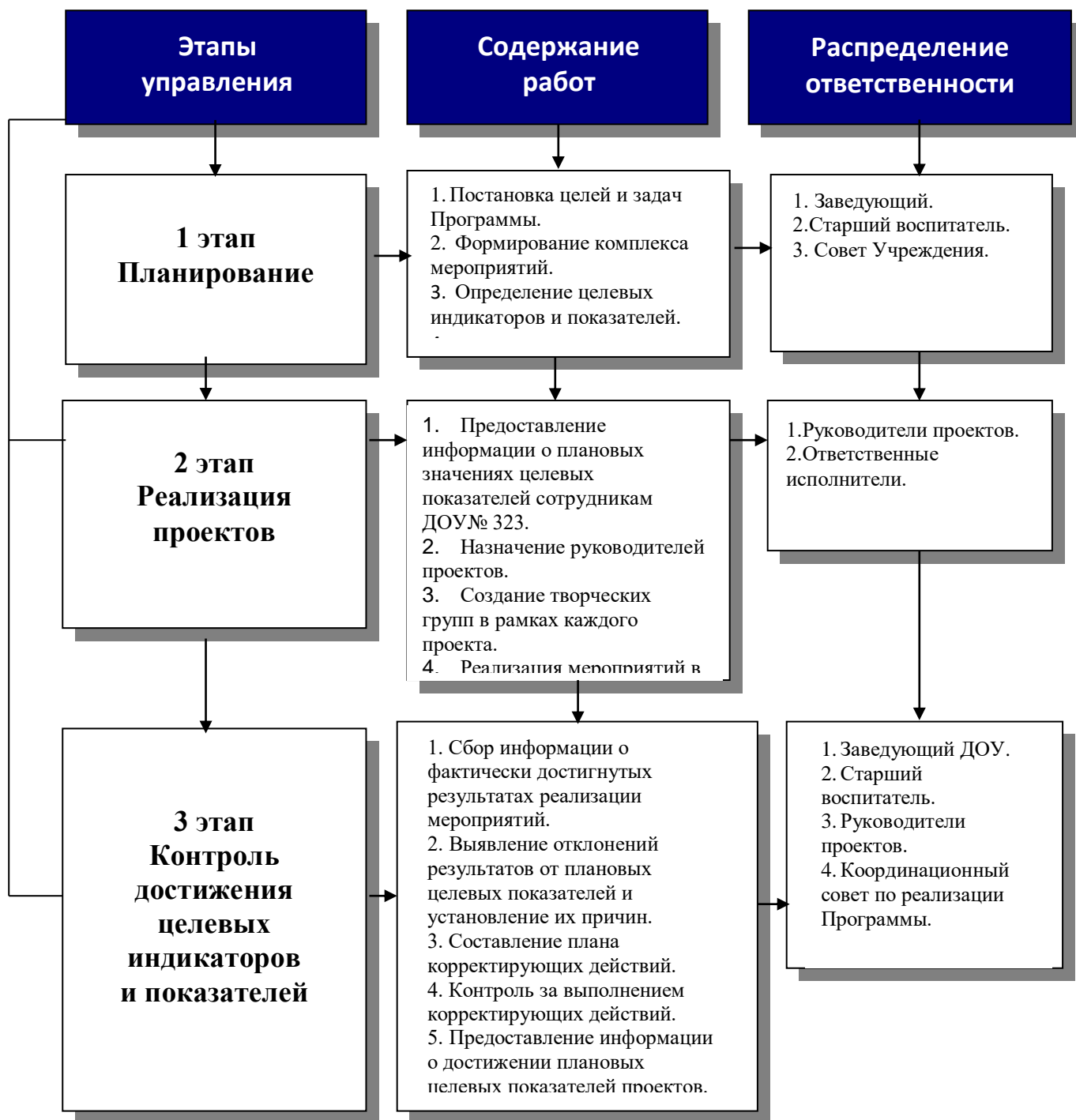
Схема управления Программой стратегического развития

В качестве координирующего органа будет создан Координационный совет по реализации Программы с включением в него руководителей приоритетных направлений развития ДООУ, ответственных за решение поставленных задач. Координационный совет будет осуществлять контроль за реализацией мероприятий и проектов Программы, организуя сбор информации о фактически достигнутых результатах реализации мероприятий, выявление отклонений результатов от плановых целевых показателей и установление их причин, составление плана корректирующих действий, контроль за выполнением